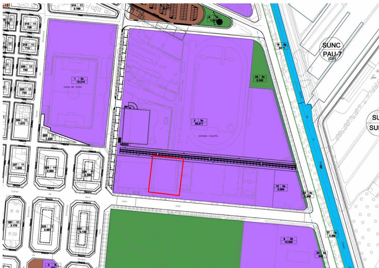
PLÀNOL TR MOD POUM 004